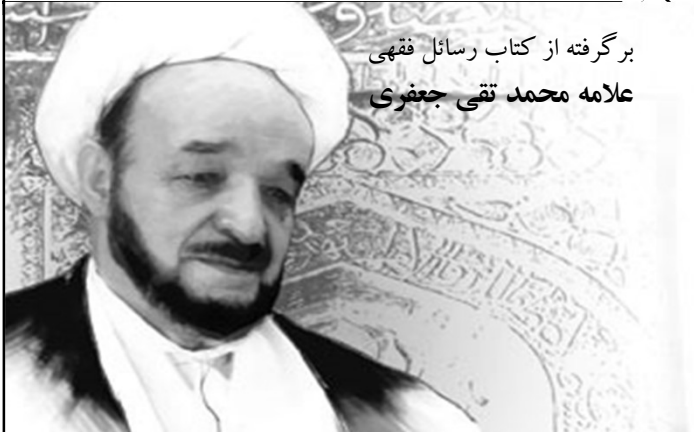
برگرفته از کتاب رسائل فقهی علامه محمد تقی جعفری